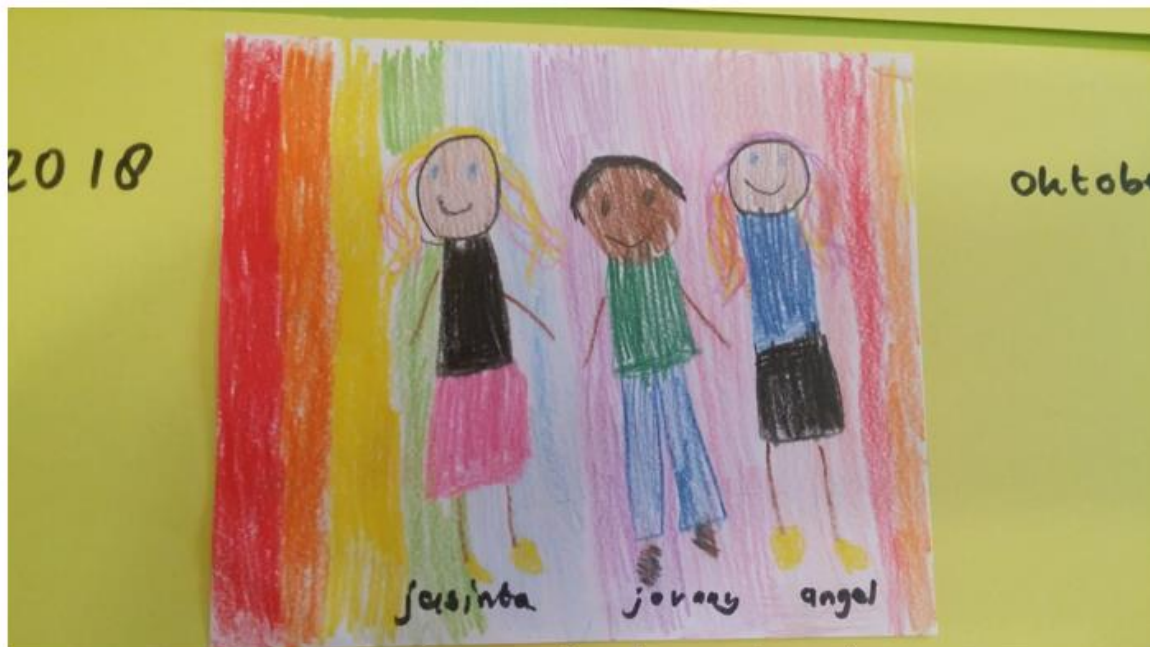
Groep 1/2C is het thema Kinderboekenweek gestart met een tekenles. Het onderwerp was: Mijn vriendje(s) en ik.