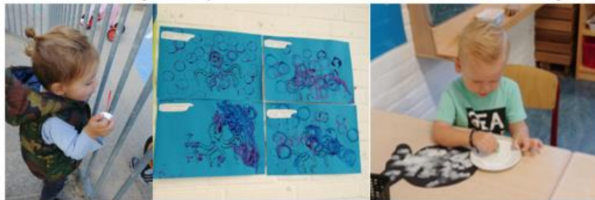
bellen blazen net als inktvis