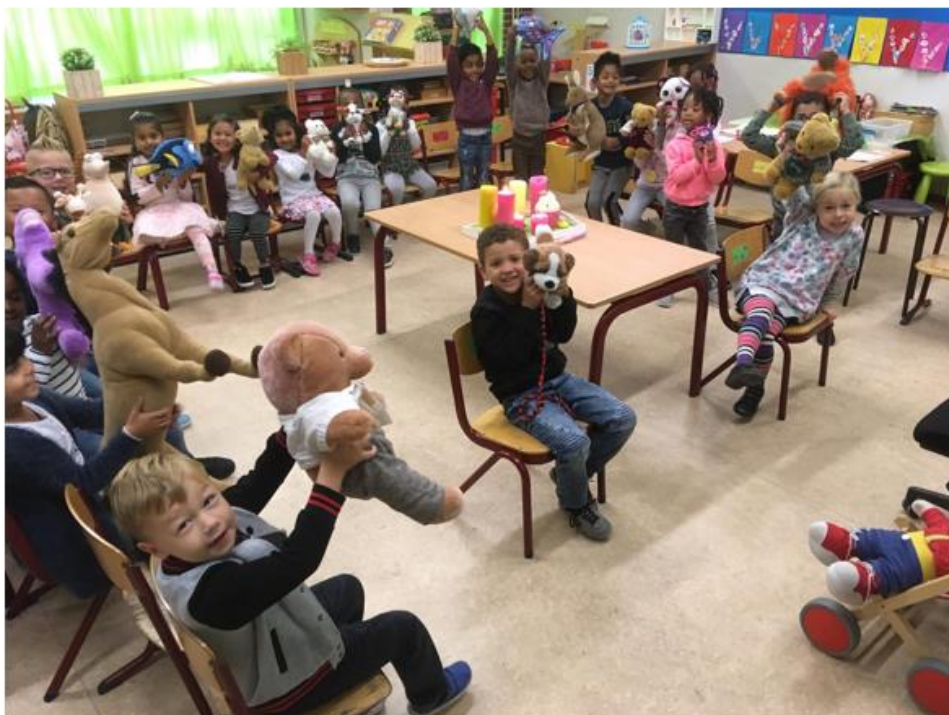
De kinderen van aroeo 1/2A namen op dierdnaa een knuffel mee naar school en vierde feest voor ieder beest.