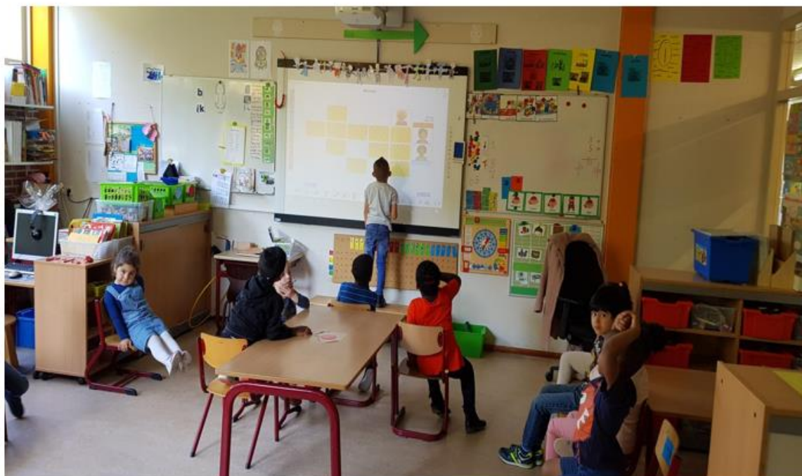
De kinderen van groep 1/2B hebben in de klas memory gespeeld. .