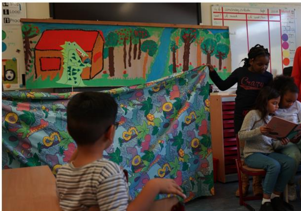
Groep 6 laat aan groep 3/4 zien wat zij geleerd hebben en andersom.